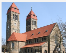
ST. CLEMENS AKTUELL

Hierzu ein wichtiger Hinweis: Wegen der geplanten Sanierung der St. Clemens-Kirche müssen die Erstkommunionfeiern im kommenden Jahr eventuell von der Pfarrkirche St. Clemens in die St. Marien-Kirche verlegt werden. Sobald es gesicherte Informationen zum Zeitplan der Sanierung gibt, werden sie im Aktuell, auf der Homepage und in der Presse veröffentlicht.