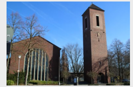
ST. MARIEN AKTUELL

Anschließend lädt die kfd zu einem geselligen Bowle-Abend in den Alten Pfarrhof ein.